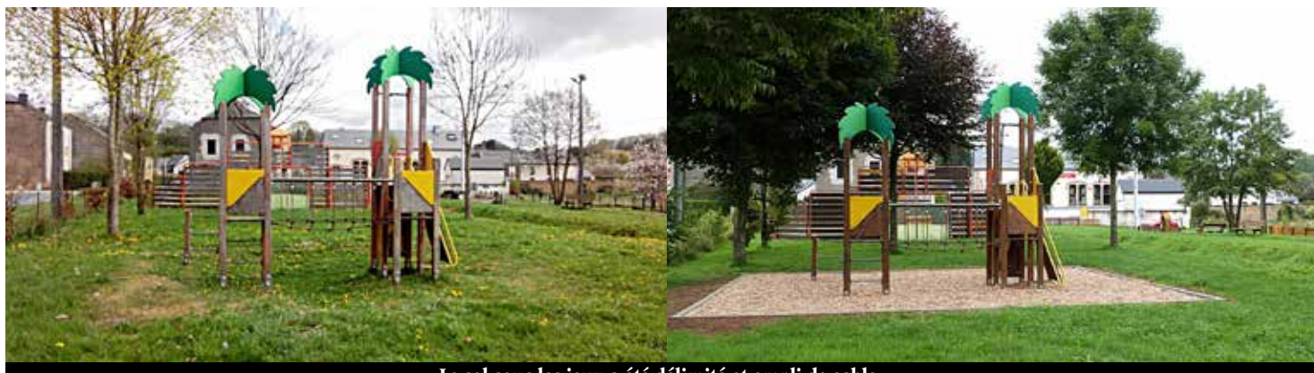
Le sol sous les jeux a été délimité et rempli de sable..