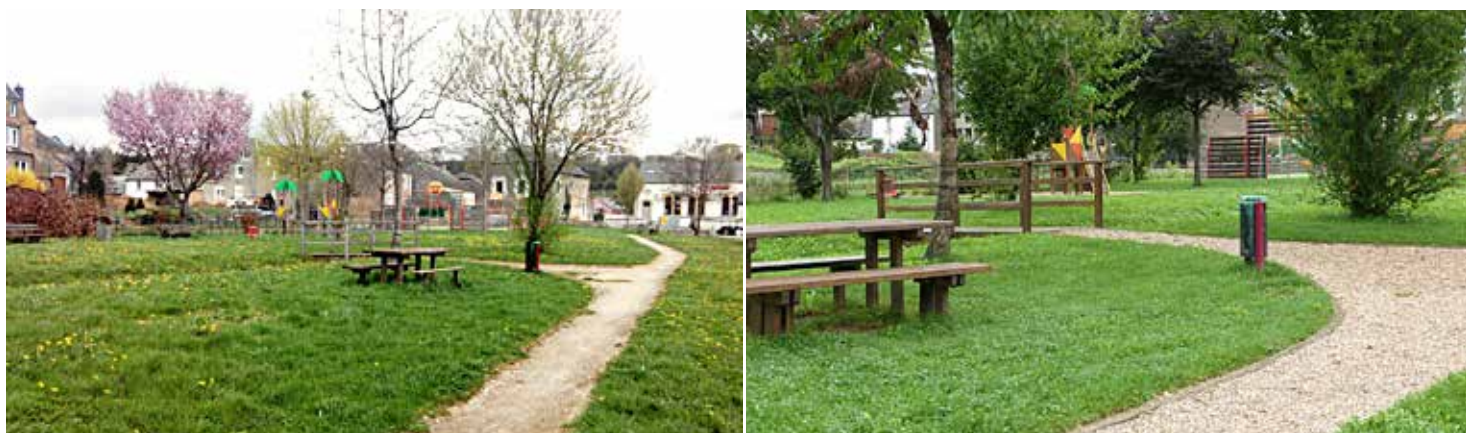
Les chemins ont été délimités par des bordures et réempierreés