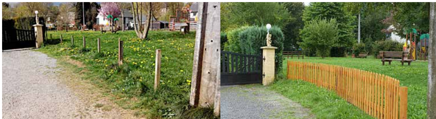
La clôture a été entièrement refaite