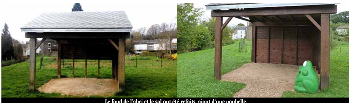
Le fond de l'abri et le sol ont été refaits, ajout d'une poubelle.