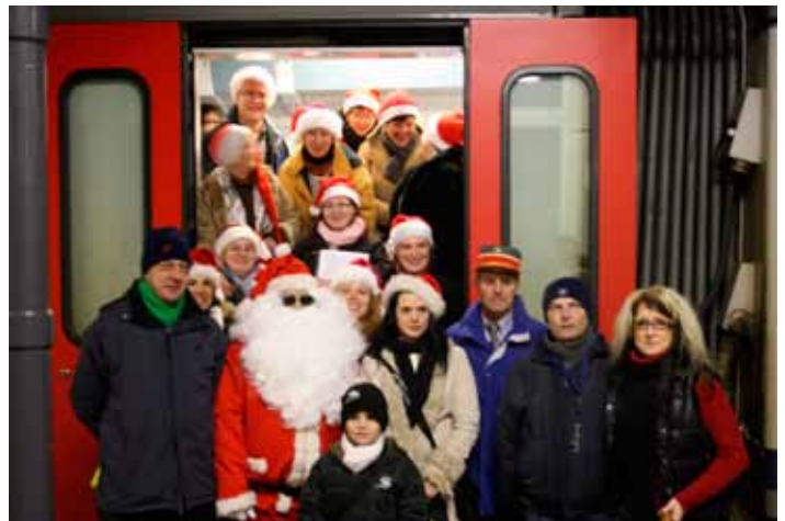
Père Noël accompagné des dames de la chorale de « l'Atelier Gaumais » et des représentants du S.I. Halanzynois

Pendant ce temps les parents, amis et curieux, transis de froid pouvaient goûter au vin chaud réconfortant ainsi qu'à la traditionnelle petite restauration proposée par les membres du S.I. local. Une bien belle soirée, unanimement appréciée qui sera à nouveau proposée l'an prochain.