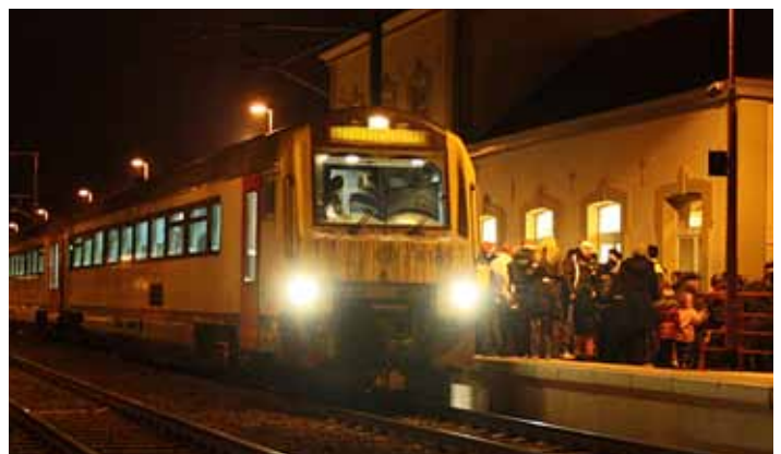
La foule sur le quai 1, en gare de Halanzy, pour accueillir Père Noël.