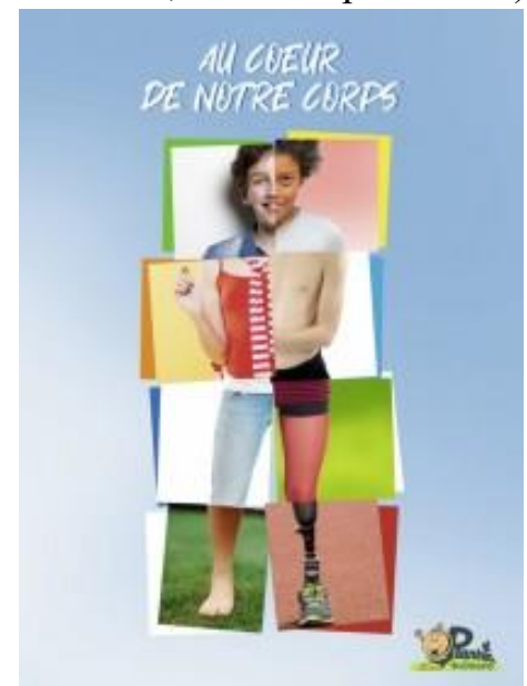
Le dossier pédagogique

Chaque enseignant reçoit un livre pédagogique sur le sujet du spectacle avec des pistes didactiques et des exercices (en l'occurrence ici, sur le corps humain).