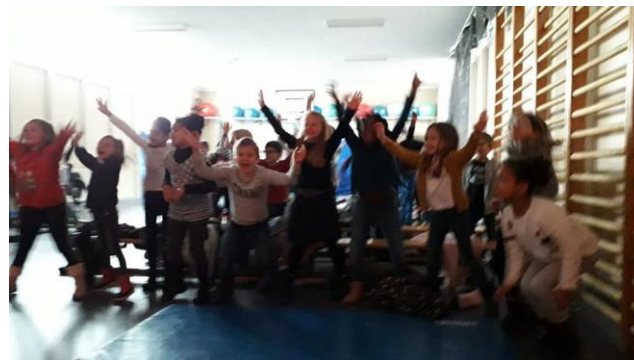
Les élèves agités lors du moment dans le spectacle où ils devaient bouger dans tous les sens pour parler du rythme cardiaque.

Notre classe, les 5-6ème primaires, accompagnés des 4èmes, a participé au spectacle intitulé « Au cœur de notre corps », que nous allons expliquer en détail.