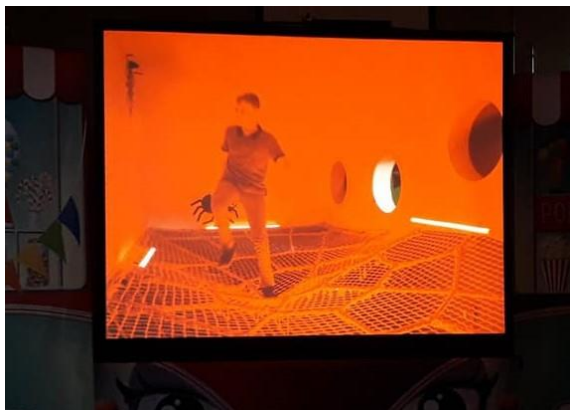
Les enfants sont en interaction avec le personnage du spectacle qui se trouve dans un « film » diffusé au projecteur.

« Planètemômes », ce sont des spectacles et animations pour enfants avec 45 animateurs venant de Belgique (Wallonie) et de France (Ile-de-France).