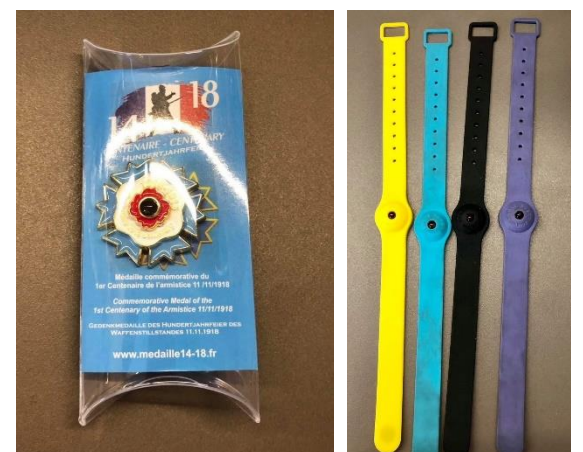
La médaille et les bracelets football 3D © Shana Nospel