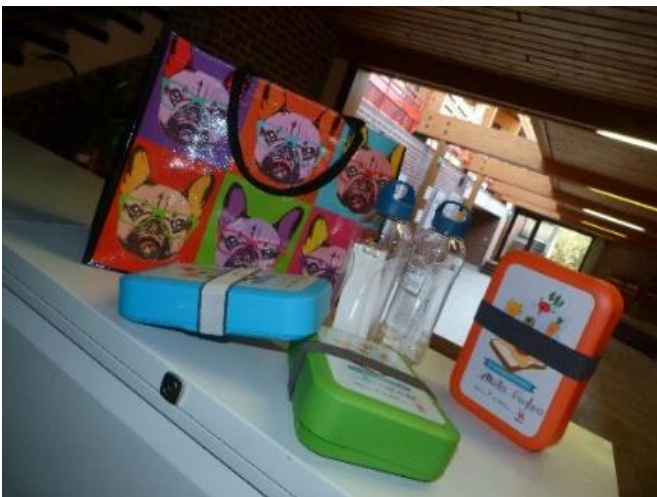
Les gourdes, boîtes à tartines et sacs réutilisables vendus par l'école

Nous avons installé ce système depuis septembre 2019. Pour ce faire, nous avons mis en place l'achat de gourdes, des collations saines offertes aux enfants à chaque récréation, des boîtes à tartines (chez les maternelles) mais également l'achat de denrées alimentaires contenant le moins d'emballage plastique possible ainsi que des sacs réutilisables.